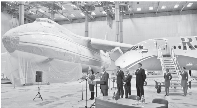
16 марта. «Спектр-Авиа». Передача заказчику SSJ-100. Слева - готовится к покраске Ан-124-100

При окрашивании использовалась современная система покрытия «База-лак», поверхностный слой которой представляет лак, имеющий большую, по сравнению с полиуретановой эмалью, степень гладкости и защищающий базовый слой краски от воздействия ультрафиолетовых лучей. Благодаря более